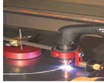
Cyrkiel do cięcia po okręgu