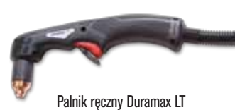
Palnik ręczny Duramax LT

Obejrzyj prezentację systemu Powermax® pod adresem www.hypertherm.com/powermax/videos/