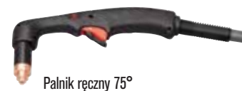
Palnik ręczny 75°

*Wydajność przebijania dotyczy zastosowania ręcznego lub z automatycznym sterowaniem wysokością palnika