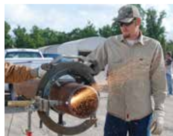
Przenośne cięcie zmechanizowane