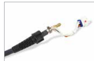
Szybkozłącze ETR (Easy Torch Removal)