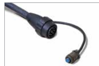
Przewód palnika ręcznego ze złączem szybkiego odłączania