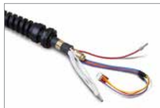
Przewód palnika ręcznego lub zmechanizowanego bez złącza szybkiego odłączania do systemów Powermax600 CE