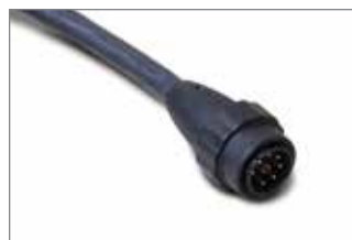
Przewód palnika zmechanizowanego ze złączem szybkiego odłączania