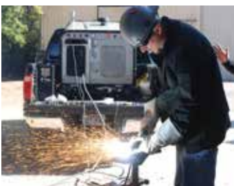
Cięcie ręczne w terenie